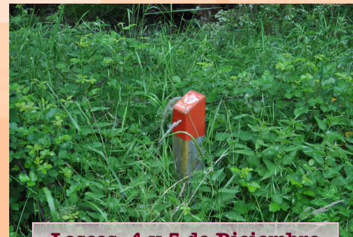
Loscos, 4 y 5 de Diciembre